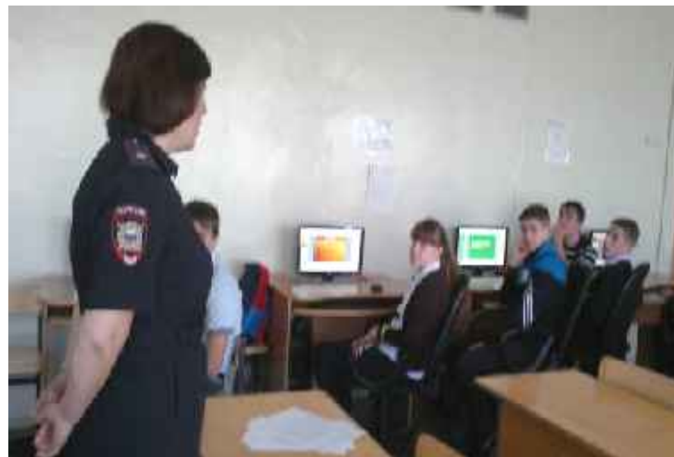
Профилактические беседы с инспектором ОДН