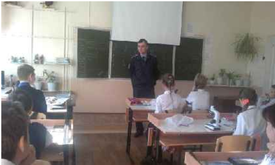
Профилактические беседы с участковым