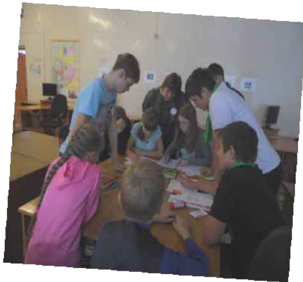
Работа над проектом « Я выбираю жизнь »