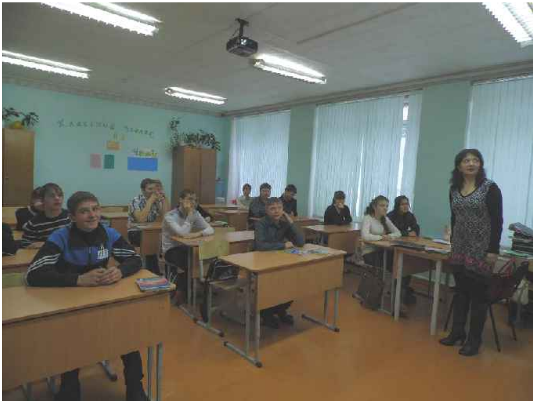
Интерактивное занятие психолога ОГКУСО «ЦСПСиД» "Что мне за это будет?"